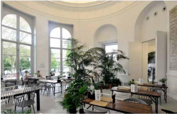
Restaurant « Madame Boverie »

En formule cocktail (maximum 150 personnes)