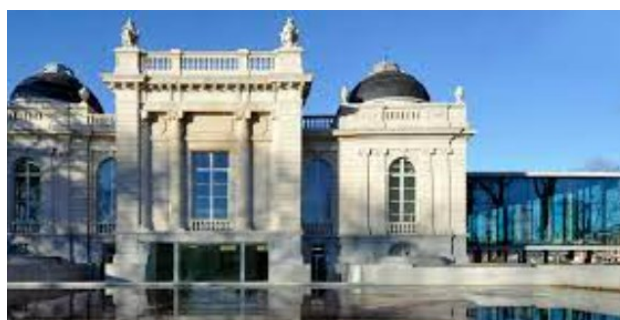
Musée de la Boverie

Un auditorium de 160 places peut être mis à disposition sur demande (moyennant un supplément).